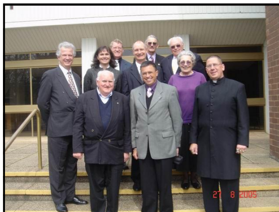
ALELDA SINODE -27.augustā, Adelaidē.